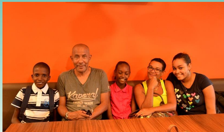
La famille J.

Son séjour en Martinique s'est terminé le Vendredi 30 Octobre 2015 à 14:30. »